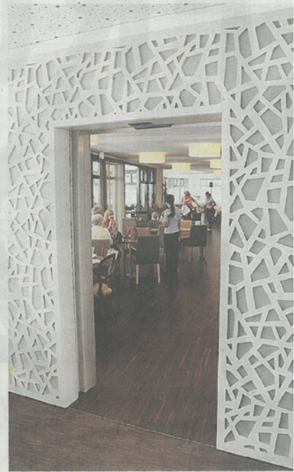
Blick vom Foyer in den Hauptraum des Restaurants.