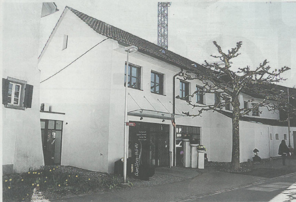
Der neu gestaltete Eingang an der Quellenstrasse 1.